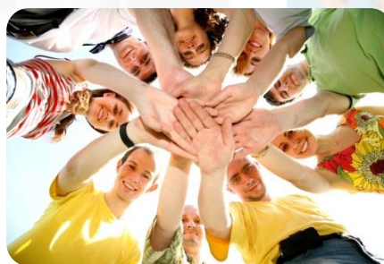
UNO DEI TUOI AMICI