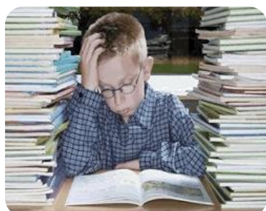
IL SECCHIONE DELLA MIA CLASSE