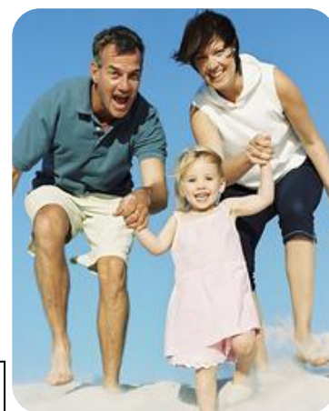
UNA MAMMA O UN PAPA'