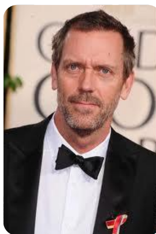
UN PERSONAGGIO FAMOSO